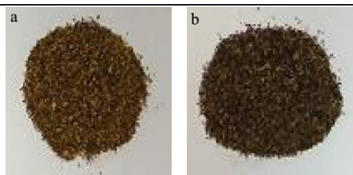
图1 护色和超声处理剂对双孢菇粉色泽的影响