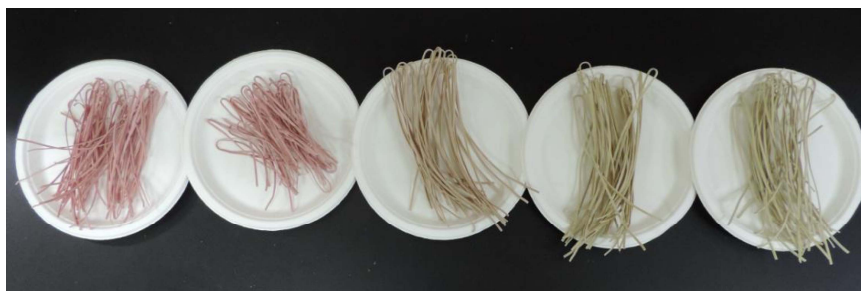
图 2 不同碱添加量的澄清甜菜汁干面条的外观照片

熟面条颜色变化类似干面条,增加碱添加量也会使熟面条的红色度明显减少, a^* 值从 7.39 降至 1.76。