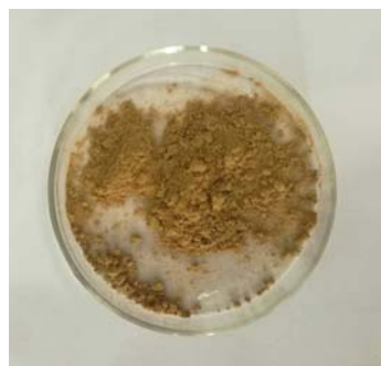
图 1 核桃种皮多酚样品

计算核桃种皮粗提物的得率为 14.34%,粗提物中核桃仁种皮多酚的含量为 19.10%。说明核桃仁种皮内多酚的含量丰富,具有较高的开发价值。