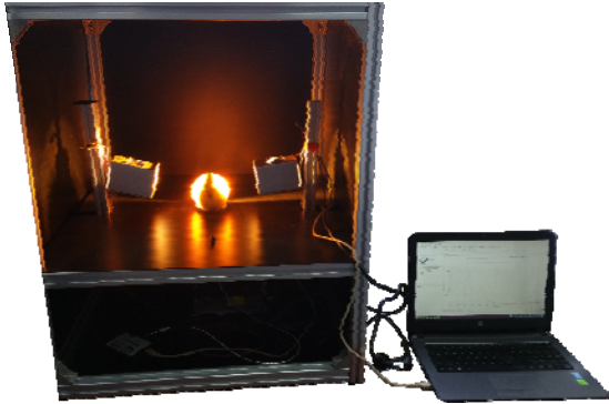
图 1 近红外透射光谱采集系统

公司的 USB 2000+型近红外光谱仪、标准 SMA905 接口的光纤、铝合金机架、暗箱与计算机等组成。光纤探头一端连接光谱仪，另一端固定在苹果托架圆心正下方，实现对近红外透射光谱的高效采集。